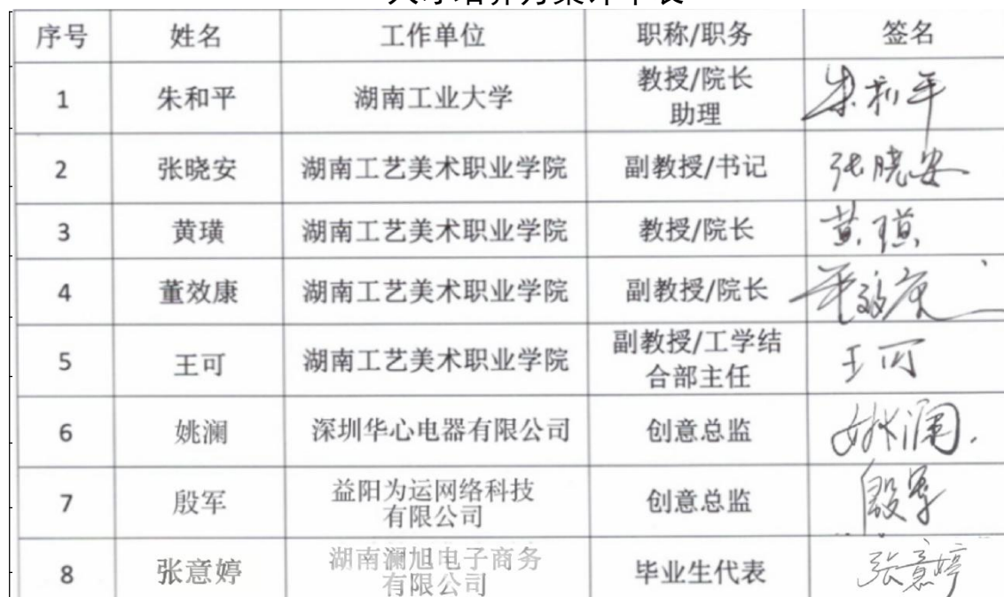
人才培养方案评审表

湖南工艺美术职业学院视觉传达设计专业（电子商务艺术设计方向）2023 级专业人才培养方案设计思路科学，条理清晰，人才培养目标定位准确，课程体系合理，课程思政有机融入，具体可操作性强，同意 2023 级采用此方案执行。