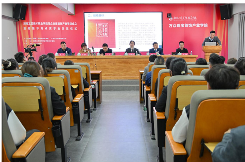
图1 湖南工艺美术职业学院万众珠宝首饰产业学院成立大会开幕式现场

设和顶岗实践。为推动首饰专业人才培养，根据教育部“逐步提高行业企业参与办学程度，健全多元化办学体制，全面推行校企协同育人”的文件精神，我公司与湖南工艺美术职业学院签署了《湖南工艺美术职业学院与广东万众珠宝有限公司共建产业学院战略合作框架协议》，并于2023年4月与该校共同成立了万众珠宝首饰产业学院，并在相关领导和老师的鉴证下举行了签约仪式，迈出了校企深度合作共建产业学院的坚实步伐。校企双方面向产业和社会发展需求，创新教育组织形态，推动校企协同育人，促进职业教育和产业联动发展，共同培养珠宝首饰设计专业技术技能人才。我公司将与该校校企强强联合，优势互补、资源共享、互惠双赢、共同发展，形成人才共育、过程共管、成果共享、责任共担的紧密型校企合作关系，在人才培养模式创新、师资互聘共用、社会服务平台搭建等方面开展深入合作、共谋发展。