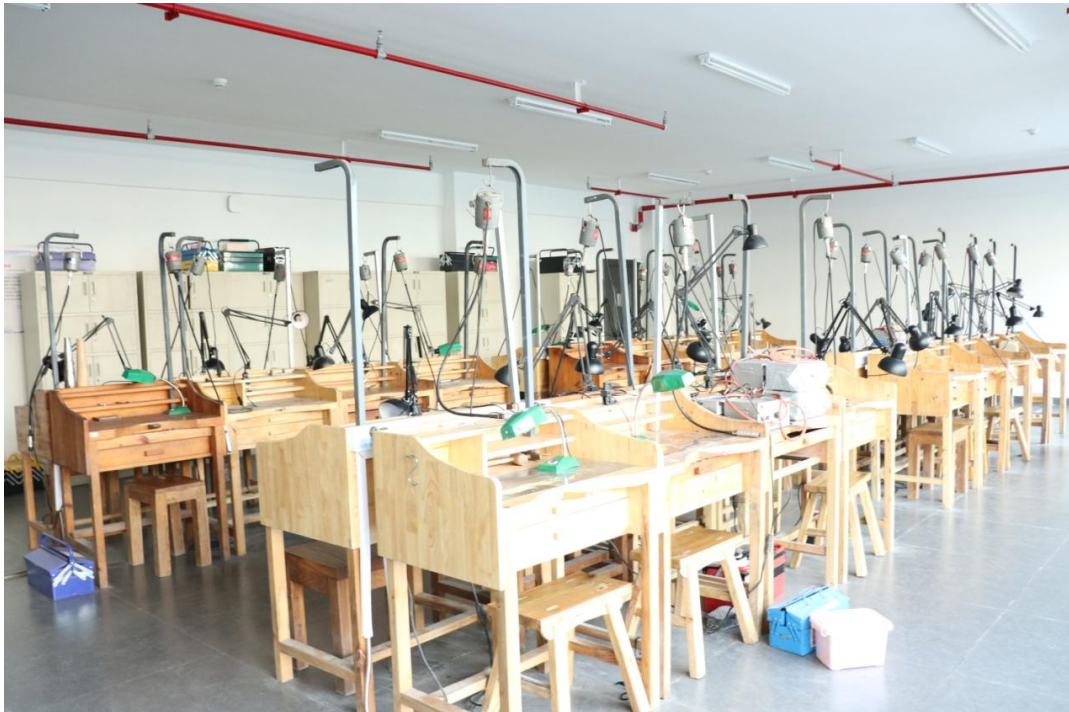
图 12 我公司与学校共建首饰金工实训室