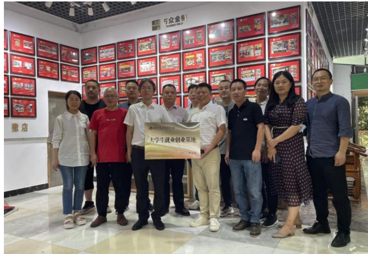
图7 大学生就业创业基地授牌并合影