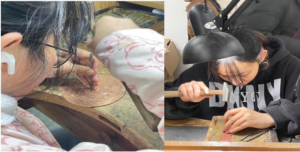
图 11 学生专业课实操实训

共同举办万众珠宝首饰创新产品设计大赛，鼓励首饰设计与工艺专业学生进行创新设计与制作，我公司提供了活动组织经费和比赛奖金，共评选出一、二、三等奖共 18 项。