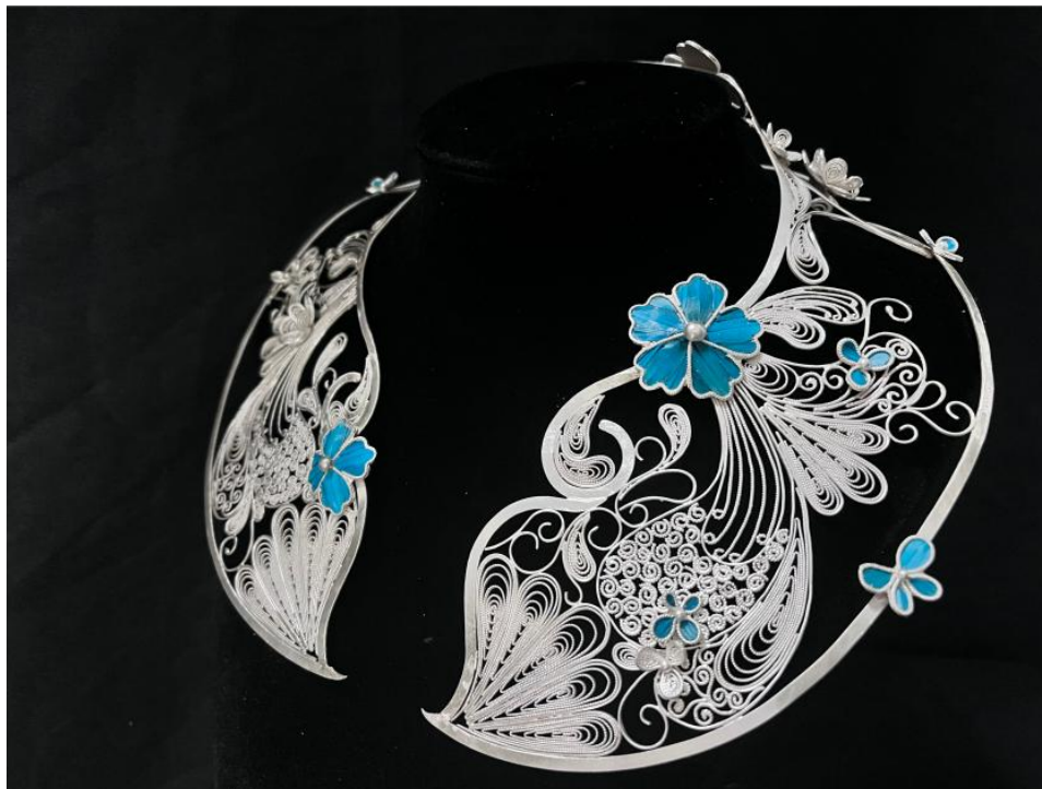
图 13 我公司与学校共同研发的首饰作品