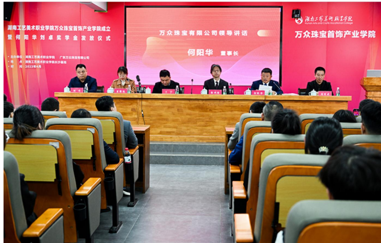
图 5 奖学金发放仪式现场