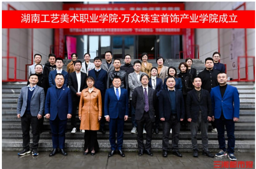
图3 湖南工艺美术职业学院·万众珠宝首饰产业学院