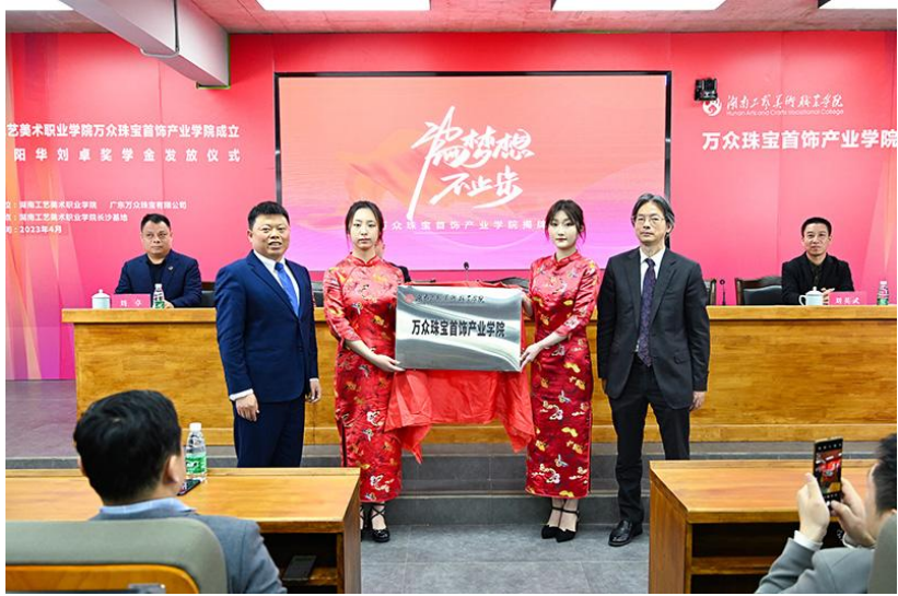
图2 万众珠宝首饰产业学院揭牌仪式现场