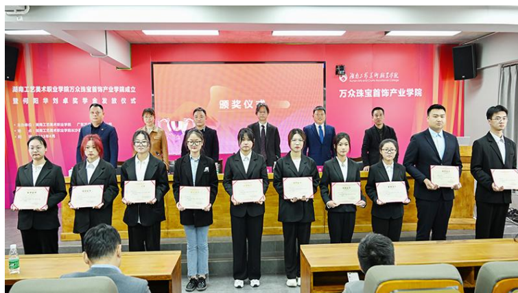
图 6 与会领导、嘉宾为 20 名获奖学生发放奖学金